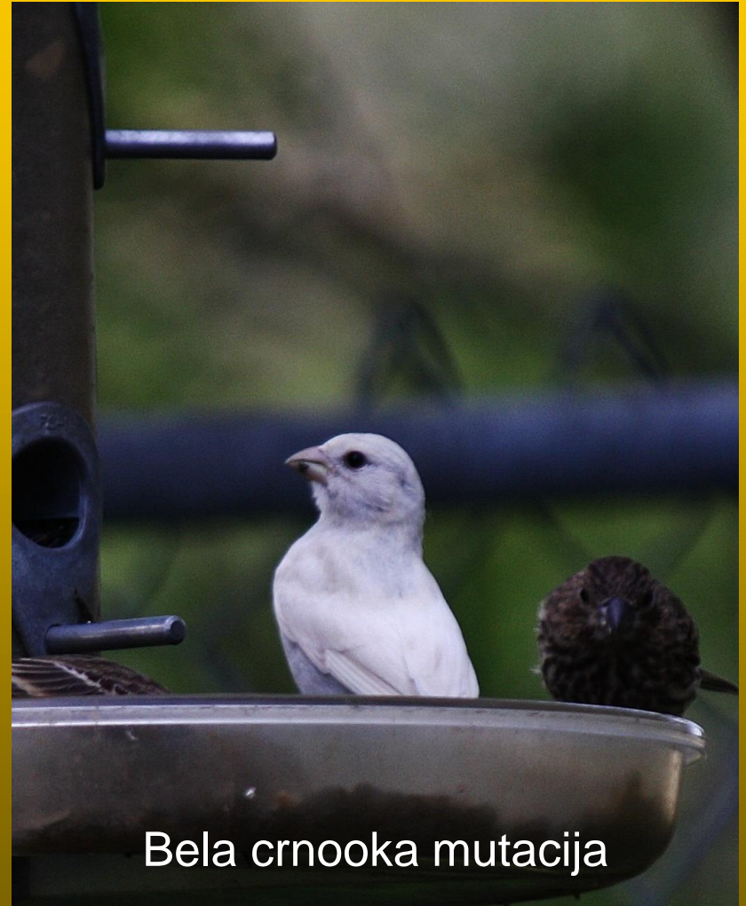
Bela crnooka mutacija