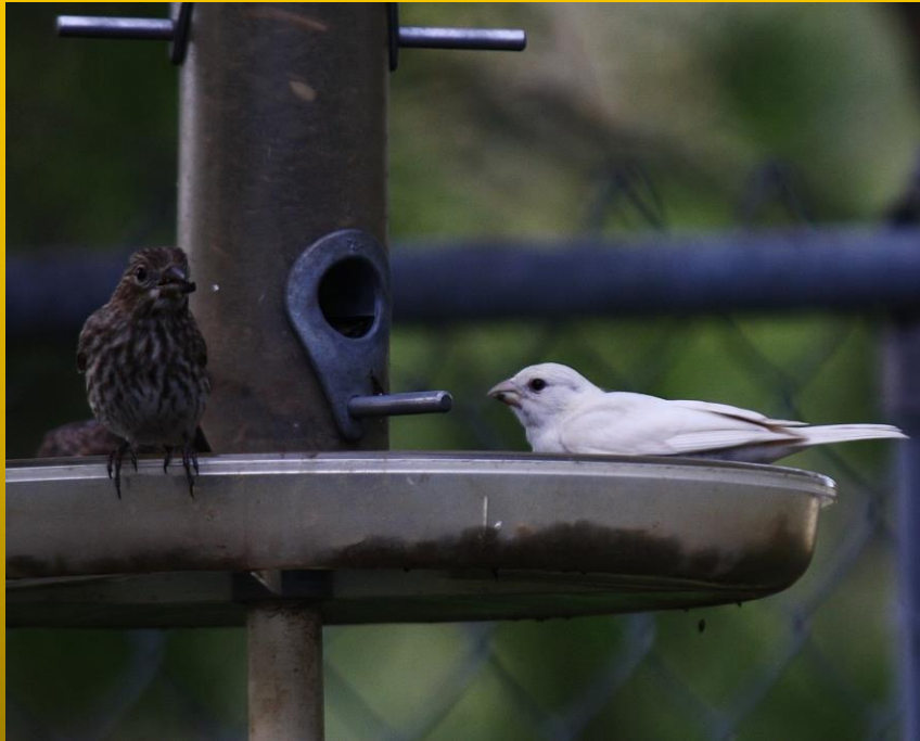
Bela crnooka mutacija iz prirode