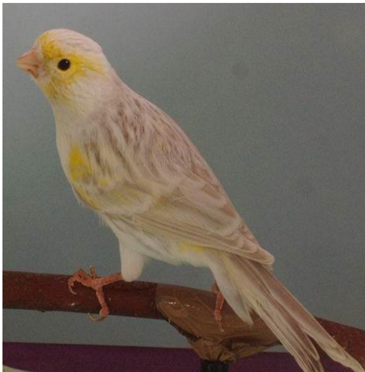
Normal melanin žuti mozaik izabela- mužijak