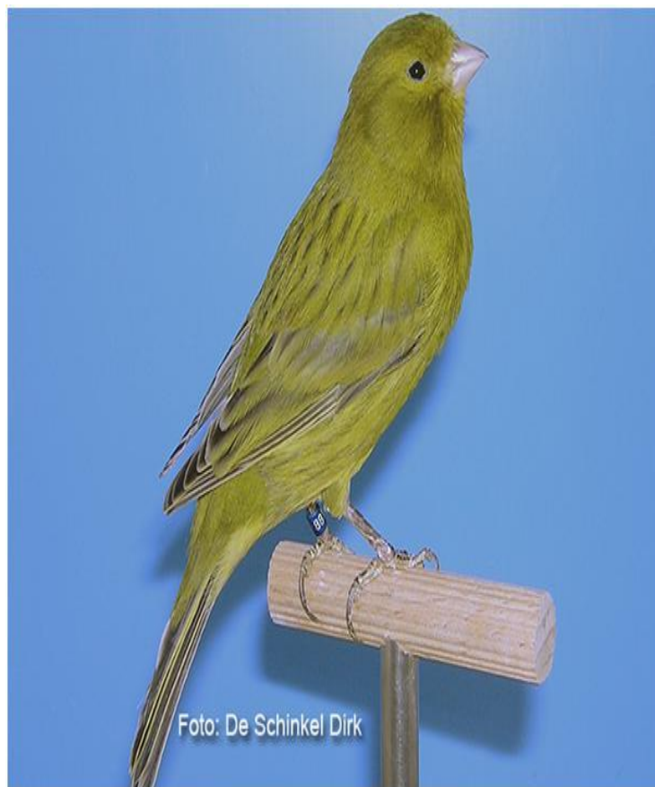
Pastel melanin žuti crne serije intenzivni