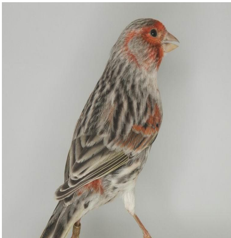
Normal melanin crveni mozaik ahat