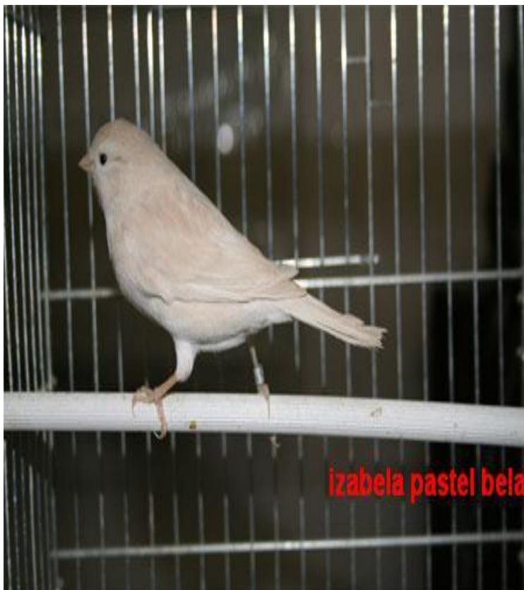
Pastel melanin beli izabel