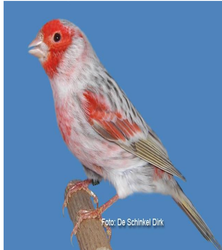
Pastel melanin crveni mozaik ahaf