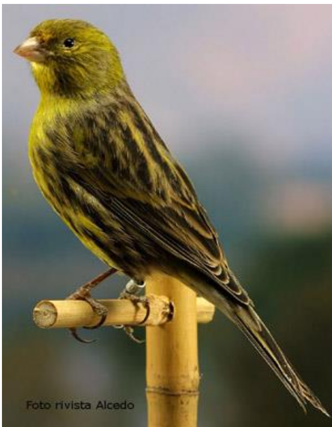
Normal melanin žuti crne serije intenzivni