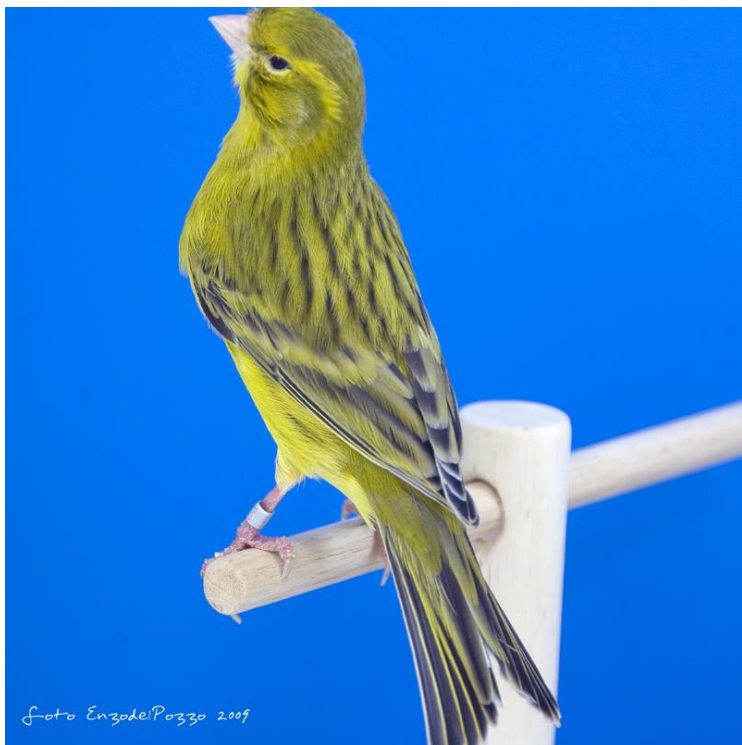
Normal melanin ahat žuti intenzivni - homozigotan