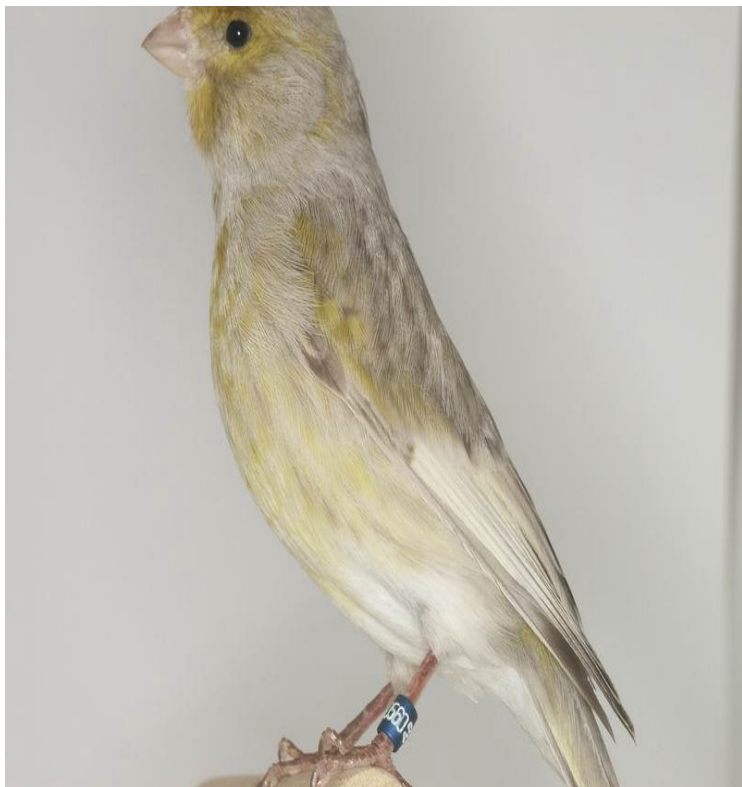
Pastel melanin sa sivim krilima