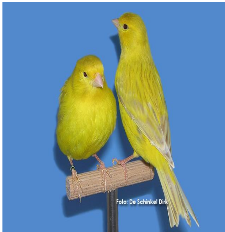
Normal melanin žuti izabel intenzivni-par