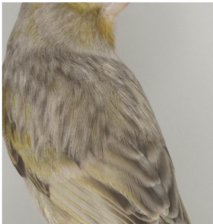
Pastel melanin sa pastelnim leđima i sivim krilima