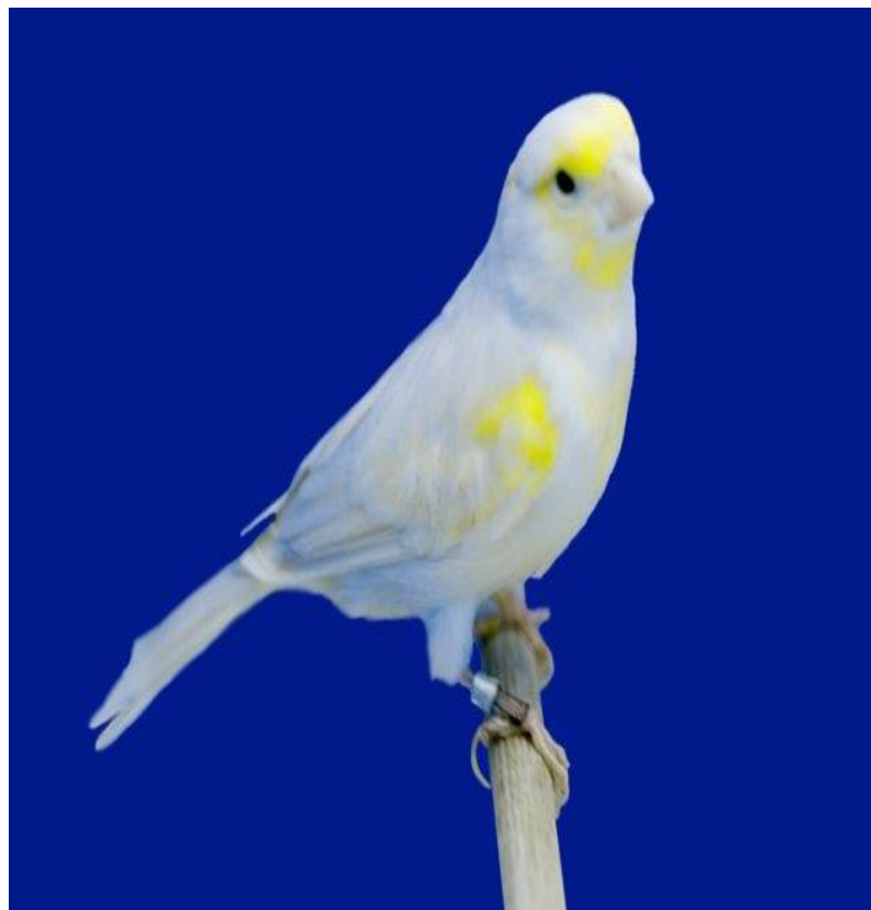
Pastel melanin žuti mozaik izabel