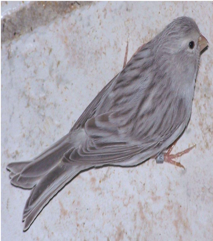
Pastel melanin ahaf beli dominantno