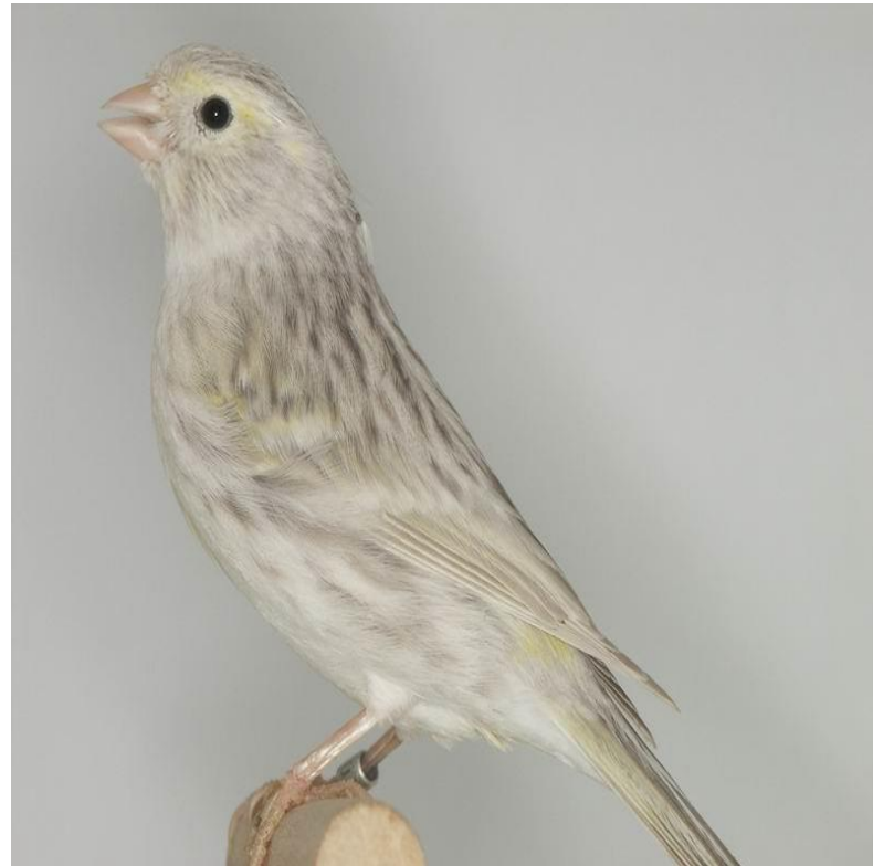
Pastel melanin žuti mozaik ahat ( sa svetlim letnim perima krila)