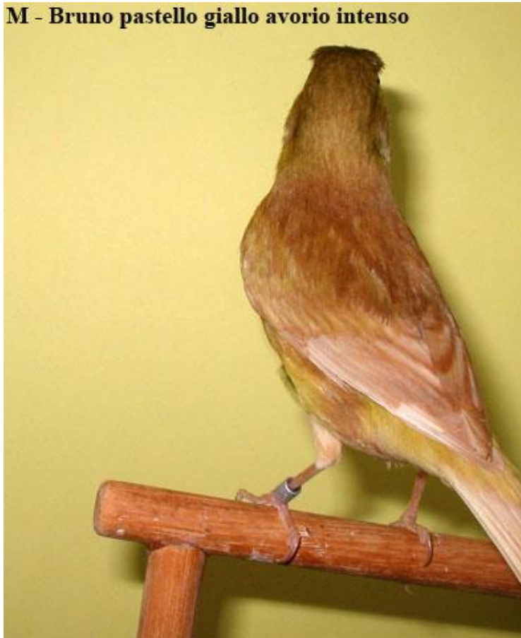
M - Bruno pastello giallo avorio intenso